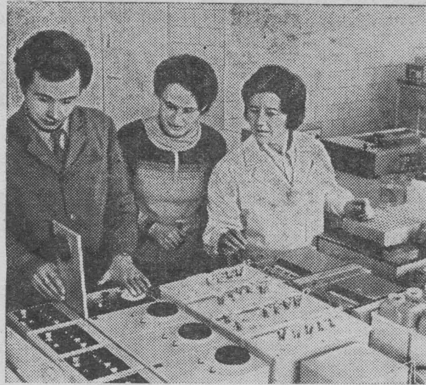
Молдавская ССР. В Кишиневском филиале Центрального института агрохимического обслуживания сельского хозяйства вступила в строй автоматизированная система лабораторий, смонтированная вместе с ЭВМ. В ее создании и монтаже оборудования принимали участие венгерские специалисты.