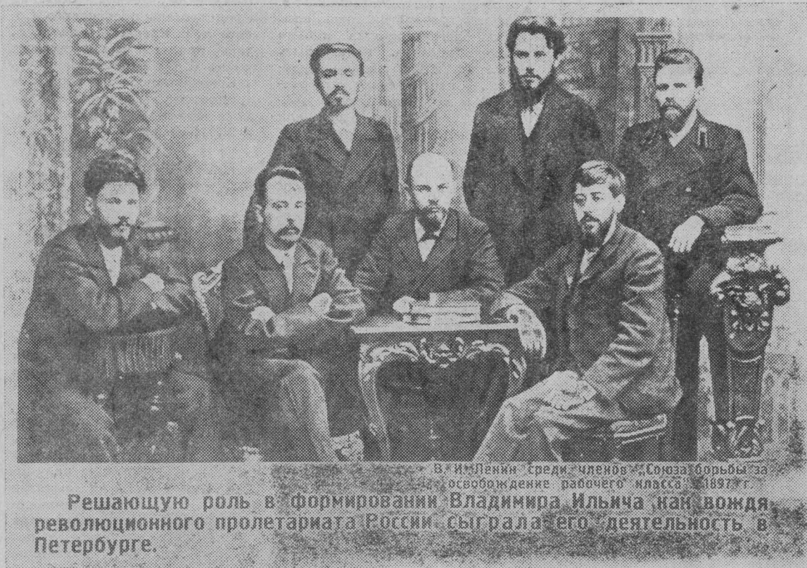
В. И. Ленин среди членов «Союза борьбы за освобождение рабочего класса» 1897 г. Решающую роль в формировании Владимира Ильича как вождя революционного пролетариата России сыграла его деятельность в Петербурге.