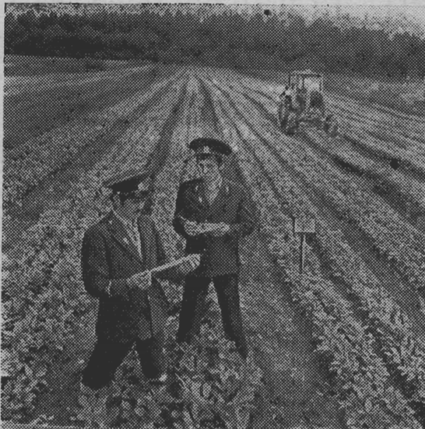
Украинская ССР. ЦК КПСС одобрил опыт работы коллектива производственного лесозаготовительного объединения «Прикарпатлес» имени 60-летия Советской Украины по эффективному использованию