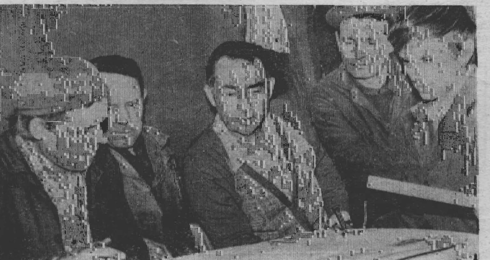
Очередное заседание редколлектива.

И последнее. Успехи коллективов наших цехов были бы весомее, если бы они не пренебрегали стенными газетами, относились к их выпуску равнодушно, творчески.