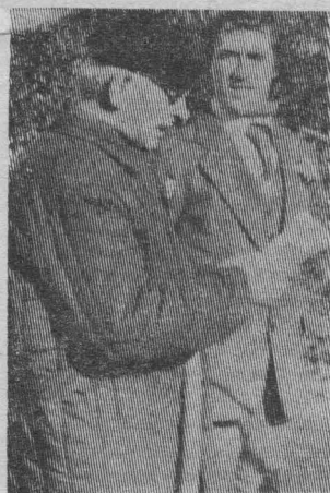
Солнечная погода, пожалуй, соответствовала настроению собравшихся на митинг перед субботником комсомольцев и молодежи. Улыбки, шутки, музыка, кра-