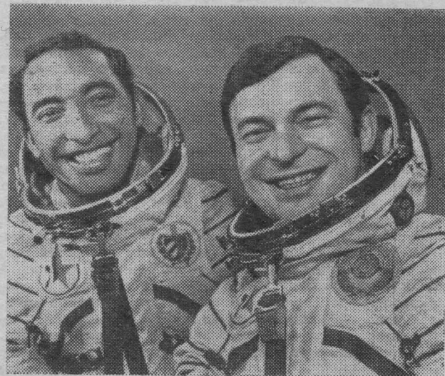
Международный экипаж космического корабля «Союз-38» — командир корабля, летчик-космонавт СССР, Герой Советского Союза, полковник Ю. В. Романенко (справа) и космонавт-исследователь, гражданин Республики Куба, подполковник Арнальдо Тамайо Мендес.