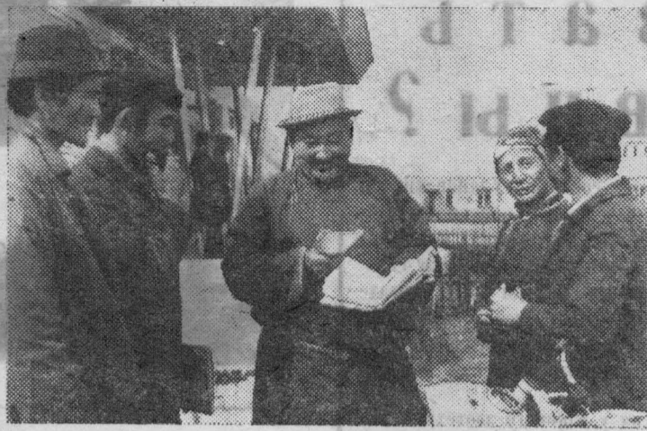
МНР. Госхоз «Дархан» имени Монголо-Советской дружбы построен с помощью СССР. Это одно из крупных сельскохозяйственных предприятий страны.

Для тружеников госхоза построены благоустроенные дома, клуб, открыты магазины.