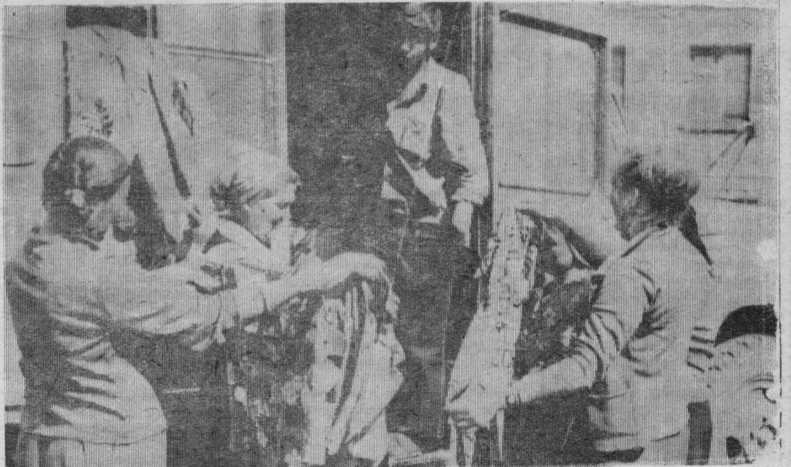
На снимке: идет бойкая торговля.