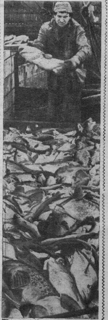
У рыбаков Севера

Десятки судов Архангельского тралового флота бороздят воды Баренцева моря в поисках косяков рыбы. Палтус, треска, морской окунь, камбала — добыча архангельских промысловиков.