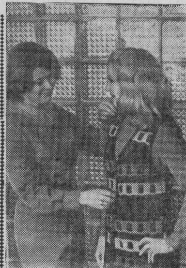
Литовская ССР. Большим спросом у покупателей пользуются шерстяные, полушерстяные и синтетические изделия, выпускаемые вильнюсской трикотажной фабрикой «Вилия».

Коллектив предприятия обязался дополнительно к годовому плану реализовать изделий на 115 тысяч рублей. Особое внимание уделяется качеству, внешнему виду продукции, обновлению ассортимента.