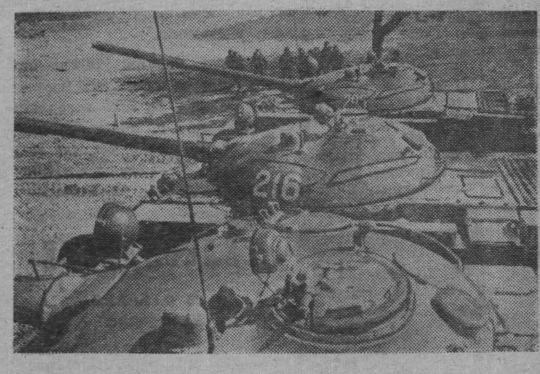
Сейчас взрывают двигатели и танки устремляются вперед.