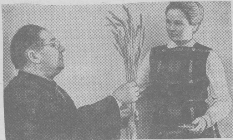
МОСКОВСКАЯ ОБЛАСТЬ. В научно-исследовательском институте сельского хозяйства цент-

ральных районов нечерноземной зоны создан новый сорт озимой ржи «Восход 1». Он устойчив к полеганию. «Восход 1» испытывается сейчас на 200 государственных сортоучастках в 45 областях Советского Союза. В прошлом году в Московской области «Восход 1» дал урожай 41,2—52,2 центнера с гектара.