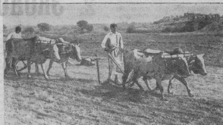
ПАКИСТАН —аграрная страна. В сельском хозяйстве занято около 80 процентов населения. Большинство крестьян владеет небольшими земельными участками, используя примитивные способы их обработки. Основная тягловая сила—крупный рогатый скот.

От имени ЦК КПСС, Президиума Верховного Совета СССР и Советского правительства Л. И. Брежнев пригласил Первого секретаря ЦК КП Кубы, Премьер-Министра Революционного правительства Фиделя Кастро, члена Политбюро ЦК КП Кубы президента республики Куба Освальдо Дортикоса, второго секретаря ЦК КП Кубы, первого заместителя премьер-министра Рауля Кастро посетить Советский Союз с дружескими визитами. Эти приглашения были с благодарностью приняты.