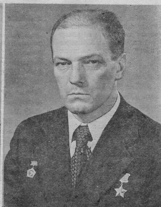
Бортинженер космического корабля «Союз-16» Николай Николаевич Рукавишников, летчик-космонавт СССР, Герой Советского Союза.