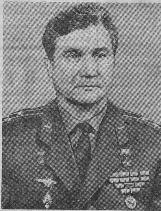
Командир космического корабля «Союз-16» полковник Анатолий Васильевич Филипченко, летчик-космонавт СССР, Герой Советского Союза.