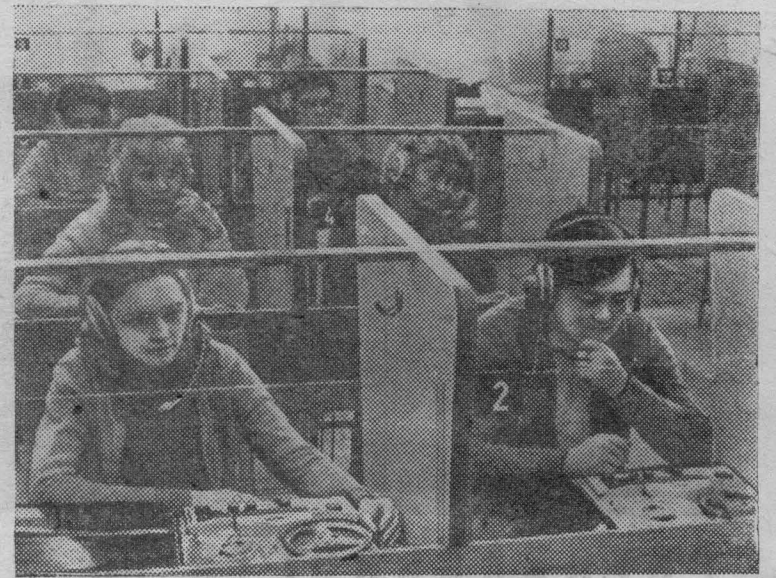
КИЕВ. В педагогическом институте имени Горького 150 преподавателей школ Польской Народной Республики совершенствуют свои знания в русском языке, знакомятся с системой воспитания и образования в СССР. Занятия рассчитаны на десять месяцев.