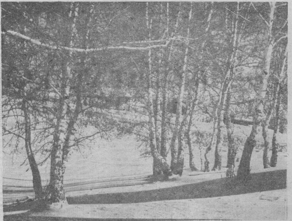
ПЕРВЫЙ САННЫЙ СЛЕД.