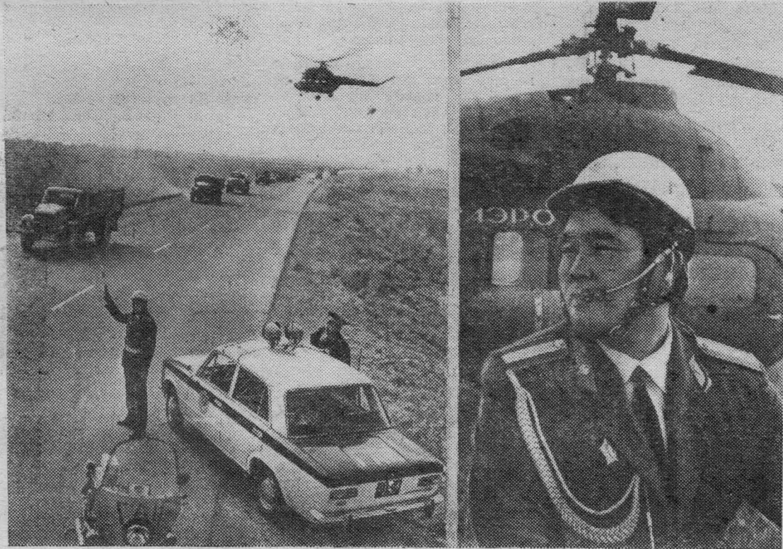
Автотрасса Рыбачье—Фрунзе—Чалдовар —самая оживленная в Киргизии. Несмотря на интенсивное движение, на магистрали зарегистрировано ежегодное снижение дорожно-транспортных происшествий.