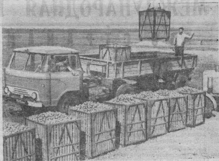
ЧЕРНИГОВСКАЯ ОБЛАСТЬ. В колхозе имени Ватутина Менского района ведут массовую уборку картофеля. Каждый гектар дает по 215-230 центнеров клубней.

На снимке: погрузка картофеля в контейнерах для отправки на приемный пункт.