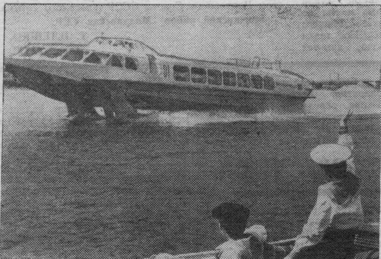
ГОРЬКИЙ. «Восход-2» — новый корабль, которому предстоит заменить «Ракету», спроектирован в ЦКБ по судам на подводных крыльях.

«Восход-2» обладает лучшей мореходностью и может совершать рейсы и по рекам, и по озерам, развивая крейсерскую скорость до 60 километров в час. Его оба салона рассчитаны на 71 пассажира.