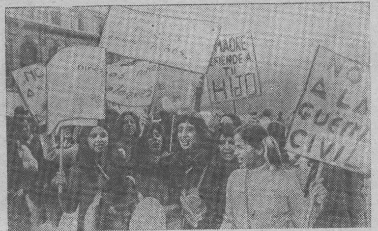
Широкие массы населения Чили все более активно выступают в защиту народной власти. В то время как реакционные силы прибегают к террористическим акциям, стремясь создать условия для развязывания в стране гражданской войны, трудящиеся демонстрируют свою крепнущую сплоченность вокруг правительства и партий народного единства.

На снимке: на демонстрации — женщины Сантьяго.