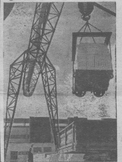
БРЯНСКАЯ ОБЛАСТЬ. Новый завод силикатного кирпича в Клинцах. До конца года он выработает несколько миллионов штук кирпича. Значительная часть продукции будет использована на строительстве в сельской местности.