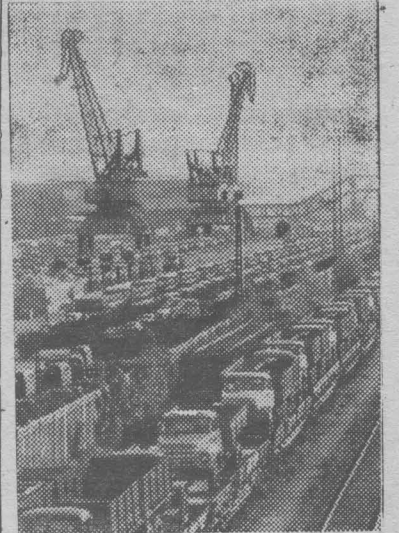
МОСКВА. Коллектив автомобильного завода имени Лихачева досрочно выполнил полугодовой план по доставкам грузовых автомобилей для сельского хозяйства. Дополнительно к плану отгружены сотни грузовиков.