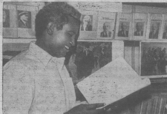
Большое число посетителей привлекла выставка советских книг, проходившая в Могадишо — столице Сомалийской Демократической Республики. На ней были широко представлены произведения В. И. Ленина, научная и художественная литература, издаваемая в СССР. На снимке: у одного из стенов советской экспозиции.