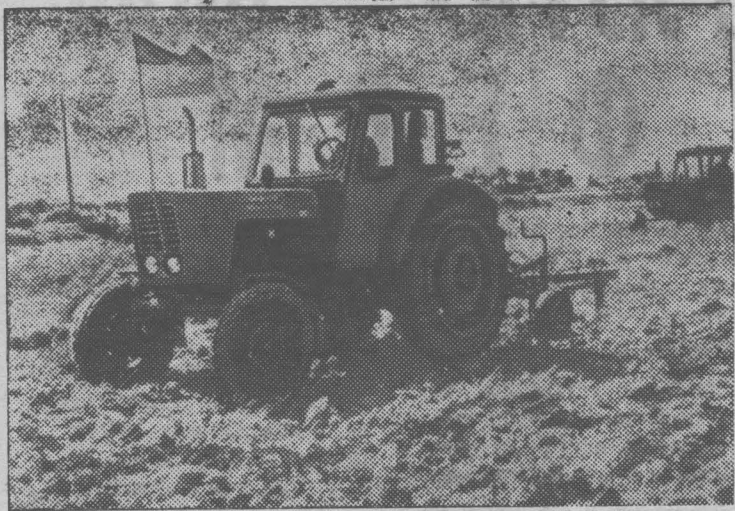
ЮЖНЫЙ ВЬЕТНАМ. Труженики провинции Куангчи за короткий срок добились больших успехов в восстановлении сельскохозяйственного производства. Площадь обрабатываемых земель нынешней весной возросла вдвое по сравнению с прошлым годом. На снимке: пахота в провинции Куангчи.