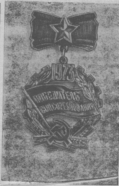
Единый общесоюзный знак «Победитель социалистического соревнования 1973 года».