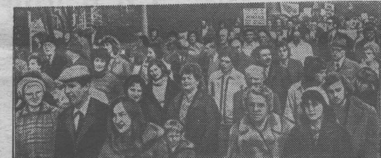
АНГЛИЯ. Уэльские металлурги продолжают вести упорную борьбу против намерения предпринимателей закрыть целый ряд сталелитейных заводов, что грозит безработицей тысячам рабочих этого района страны.

На снимке: во время демонстрации металлургов.