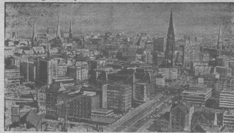
Панорама Гамбурга—крупнейшего промышленного и портового центра ФРГ, города, поддерживающего дружеские связи с советским Ленинградом.