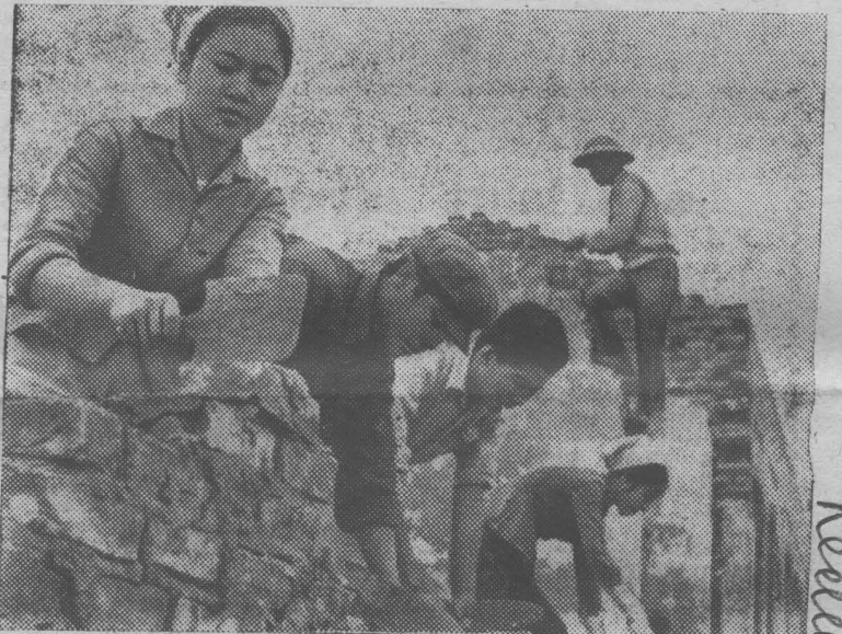
В городах и деревнях, цехах заводов и на полях — всюду в ДРВ в эти дни идет подготовка к выборам в Народные советы районов, общин, поселков и городов провинциального подчинения.

ПАРИЖ. Свыше 100 человек арестовано в Португалии под предлогом «предотвращения публичных манифестаций».