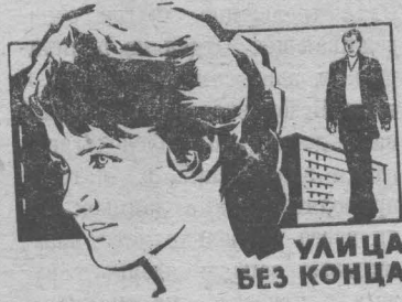
УЛИЦА БЕЗ КОНЦА

поставлен фильм «Алые маки Исык-Куля». Кинолента посвящена мужественной беззаветной борьбе советских пограничников с умными, опасными, зачастую отлично замаскировавшимися врагами в 20-е годы.