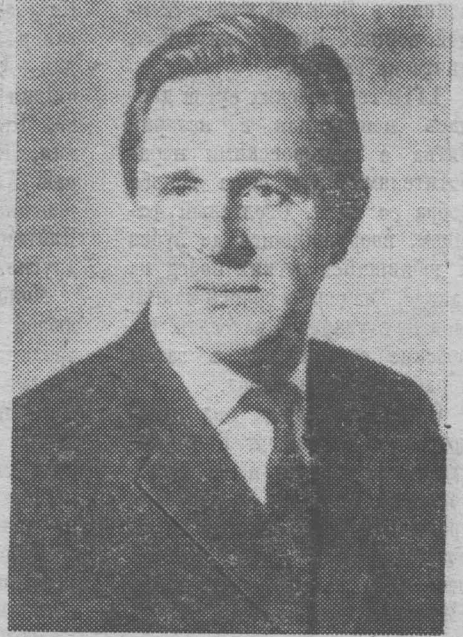
Л. И. Брежнев—общественный и политический деятель (СССР); Сальвадор Альенде—общественный и государственный деятель (Чили); Энрике Пасторино—Председатель Всемирной Федерации Профсоюзов (Уругвай); Джеймс Олдридж—писатель, общественный деятель (Англия).