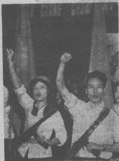
Молодежь Демократической Республики Вьетнам выражает решимость бороться до победного конца за независимость и свободу вьетнамского народа.