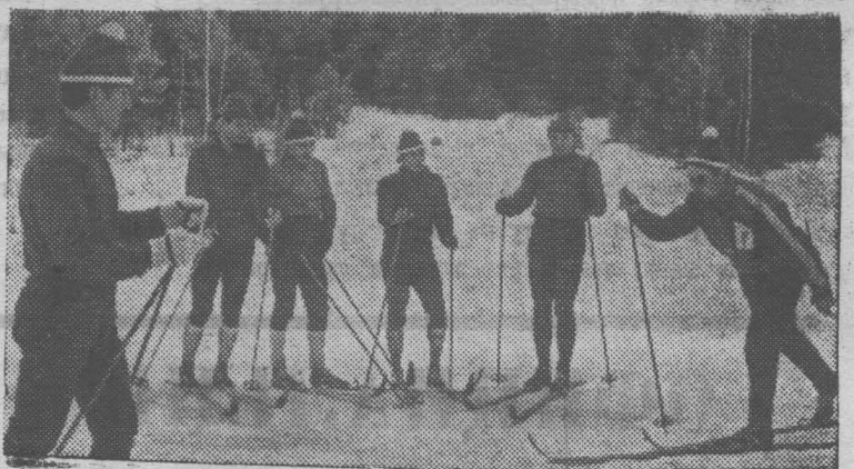
Более пяти тысяч специалистов подготовил Свердловский техникум физкультуры. На снимке: учащиеся техникума на занятиях по лыжной подготовке.