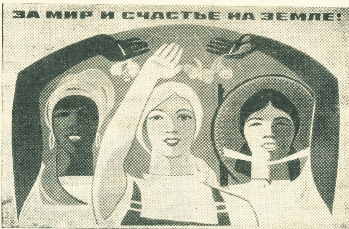
ПЛАКАТ ХУДОЖНИКА Э. АРЦРУНЯНА