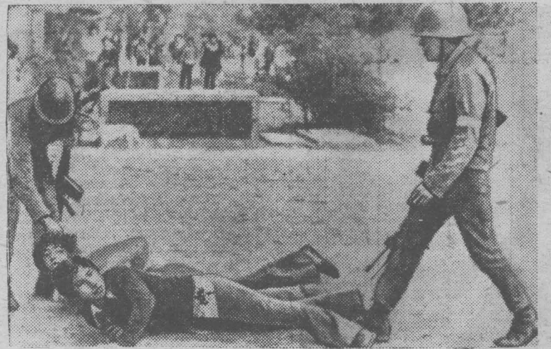
ЧИЛИ. Обстановка в стране остается крайне напряженной. Повсеместно продолжаются повальные обыски и облавы, аресты и расстрелы патриотов.

На снимке: солдаты военной хунты проводят очередную облаву в Сантьяго.