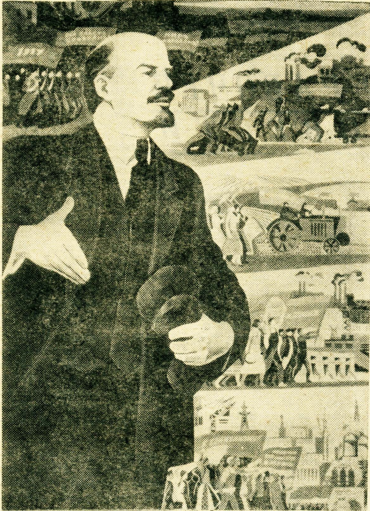
Плакат художника Э. Арируняна (издательство «Изобразительное искусство»).