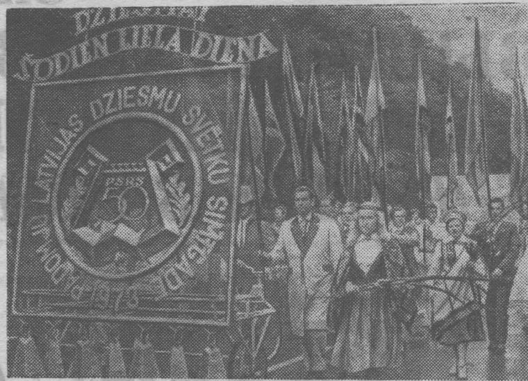
Яркое, незабываемое впечатление оставил большой праздник песни, посвященный 50-летию образования СССР и 100-летию певческих праздников Латвии.

В грандиозном юбилейном представлении приняли участие народные танцевальные коллективы, духовые оркестры, участники ансамблей, играющих на старинных латышских музыкальных инструментах.