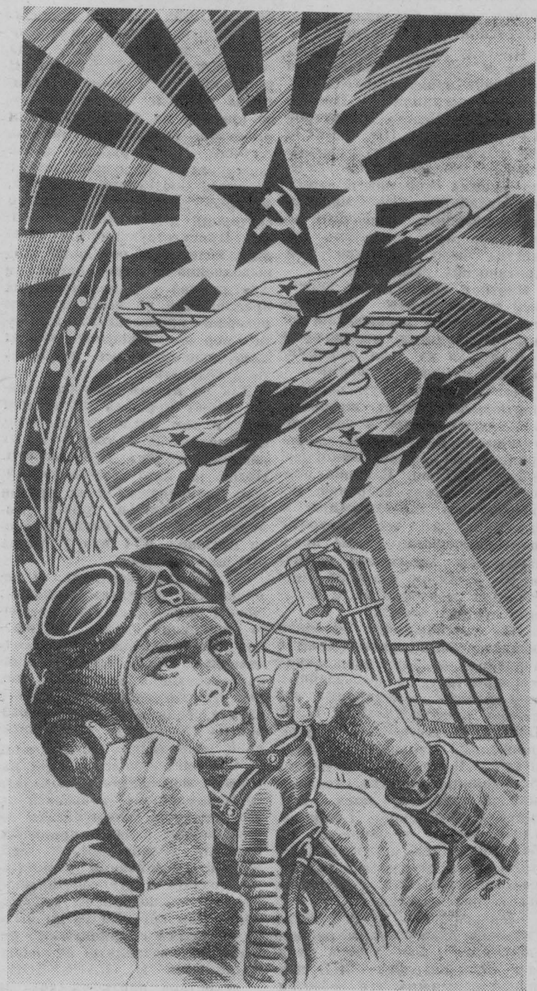
На страже мирного неба.