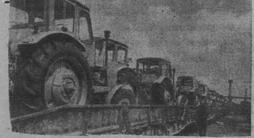
На Минском тракторном заводе за истекшие четыре года прирост производства составил 32 процента. Тракторостроители прилагают все силы для дальнейшего увеличения выпуска машин. С начала года выпущено несколько десятков сверхплановых тракторов. На снимке: тракторы перед отправкой.