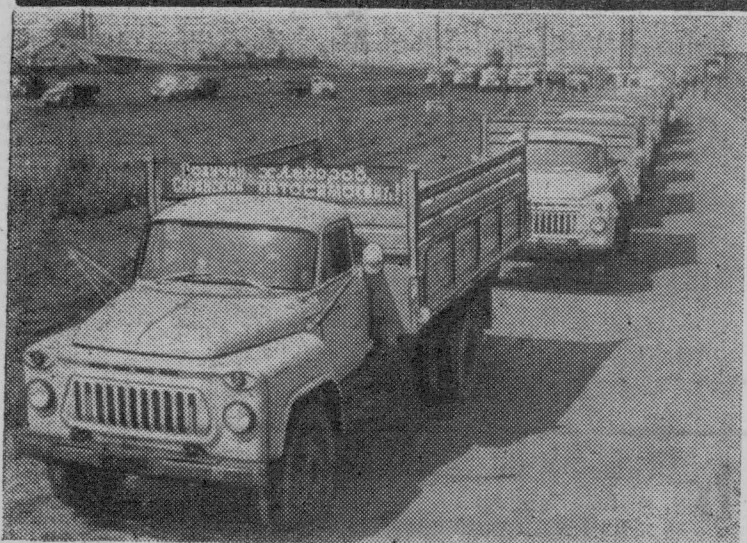
МОРДОВСКАЯ АССР. Ежедневно из ворот Саранского завода автосамосвалов отправляются в разные области страны колонны машин.

С каждым годом предприятие набирает силу. С начала пятилетки выпуск автомобилей увеличился на 30 процентов. Подавляющее большинство их идет в села страны.