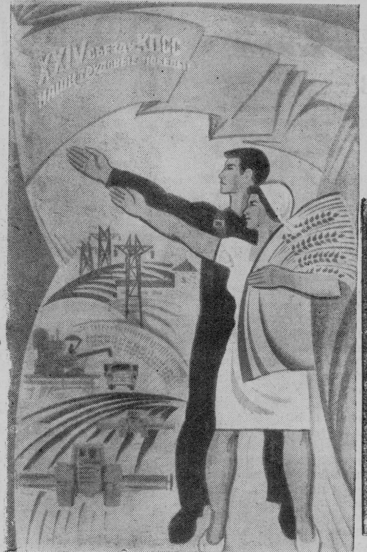
XXIV съезду КПСС—наши трудовые победы!

тов. Отмечена неудовлетворительная работа на заготовке кормов в совхозе „Вознесенский“, где план выполнен всего на 36 процентов.