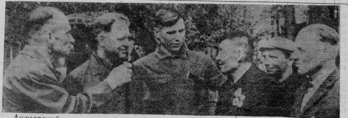
Анжерский лесозаготовительный участок Яйского лесопромышленного комбината — крупное механизированное хозяйство. Здесь трудится дружный коллектив лесозаготовителей, успешно выполняющий обязательства последнего года пятилетки.

Н. ЕПИХИНА, сотрудник редакции газеты „Вперед к коммунизму“.