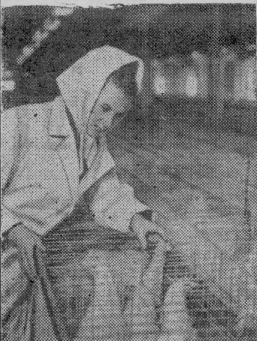
Хмельницкая область. В колхозе «Украина» Летичевского района сооружен птичник-автомат с программным управлением. В цехе клеточного содержания размещено 12 тысяч несушек, процессы ухода за ними выполняют машины. На ферме работают только два человека.