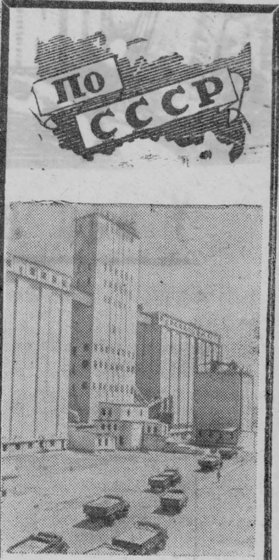
Ставропольский край. Днем и ночью по степным дорогам идут машины с пшеницей и ячменем нового урожая. В крае работает 42 хлебоприемных пункта, которые ежедневно принимают до 200 тысяч тонн зерна. На Благодарненском хлебоприемном пункте все трудоемкие процессы механизированы. Разгрузка автомашин занимает 6-7 минут.