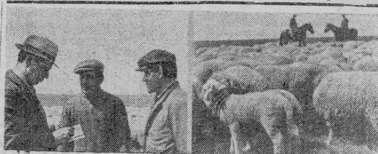
Омская область. Успешно трудятся овцеводы лограммов шерсти. Нынешней весной от сотни овцематок получено в среднем 129 ягнят.