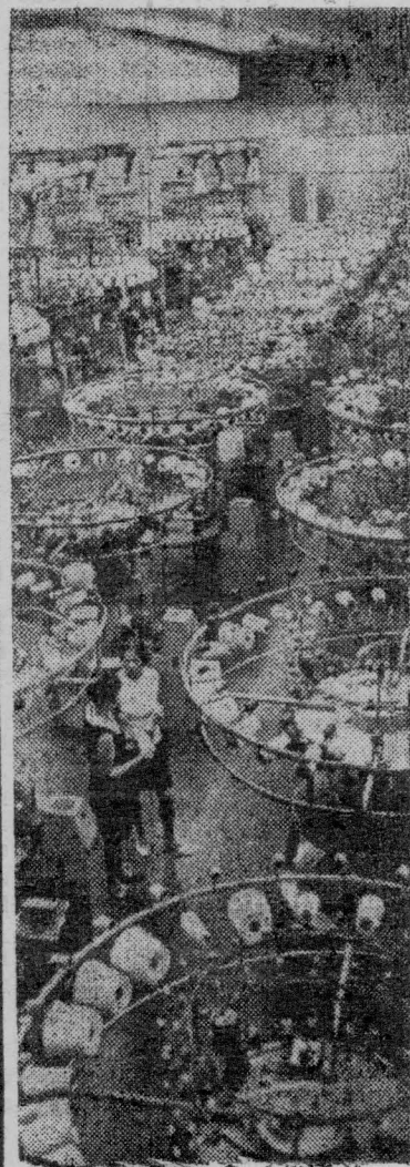
Кемеровская область. Беловская трикотажная фабрика — молодое предприятие Кузбасса.

В просторных светлых цехах фабрики установлено современное оборудование. Следуя почину записовцев, коллектив предприятия успешно осваивает практические мощности, борется за высокое качество и увеличение выпуска продукции. Только в этом году фабрика поставит магазинам городов и сел свыше 17 миллионов штук нижнего белья.