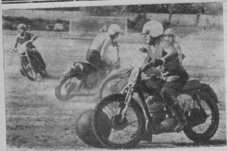
СВЕРДЛОВСК. В 1929 году жители одного из французских городов были удивлены, увидев на футбольном поле спортсменов, гонящих мяч, сидя на мотоциклах, и старающихся забить его в ворота, защищаемые вратарем, также сидящим на мотоцикле. Так появился новый вид спорта — мотобол. Мотобол включен в зачет Всероссийской спартакиады по военно-техническим видам спорта.

В Свердловске эта спортивная игра делает первые шаги. На днях команда Свердловского областного автомото клуба ДОСААФ провела первый официальный матч первенства Уральской зоны по мотоболу с командой города Челябинска. Победу одержали более опытные гости.