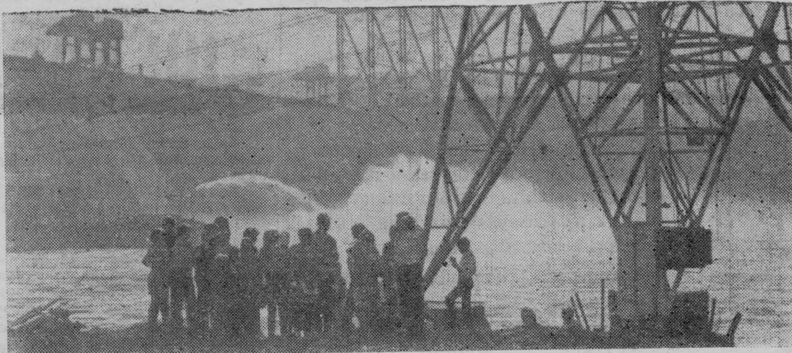
На Красноярской ГЭС проводятся испытания водосливной части исполтинской плотины, что перекрывает великую сибирскую реку Енисей.

Мощные потоки воды огромным водопадом устремляются вниз со стометровой высоты, разбиваются о водобойную часть, взмывают вверх и, укрощенные, опускаются в нижний