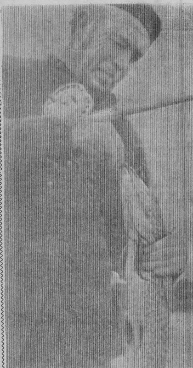
Вот так удача!

— Нет, в магазине была огромная очередь, больше не отпускали.