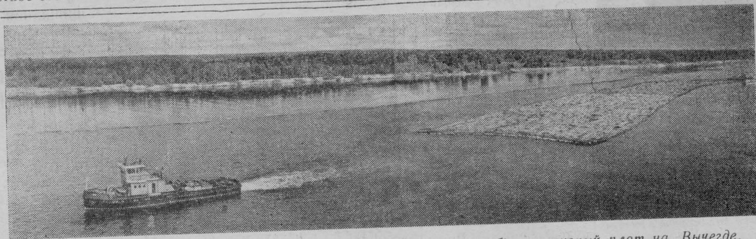
Коми АССР. Река Выгегда — основная сплавная магистраль республики. Ежегодно по реке и ее притокам доставляется потребителям свыше пяти миллионов кубометров древесины.

За новые нарушения они будут подвергаться ответственности в административном порядке».