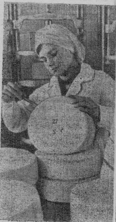
Климовский сыравоз — одно из передовых предприятий Брянской области. В этом году здесь будет выработано 290 тонн высококачественного сыра. Уже выпущено несколько тонн продукции сверх плана.

Прогрессивный метод аэроионизации животноводческих помещений показывается на ВДНХ СССР.