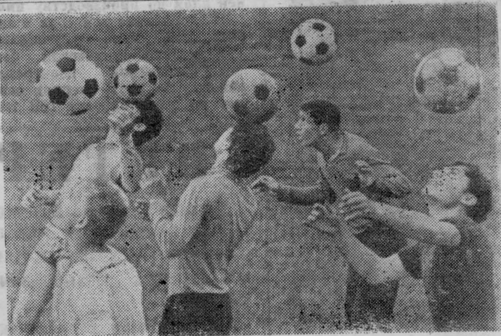
КРАСНОДАРСКИЙ КРАЙ. Любят спорт на Кубани. Много здоровых парней и девушек в стаицах. Они работают в колхозах и совхозах, учатся, а в свободное время с увлечением играют в футбол, в волейбол, катаются на велосипедах, посещают спортивные секции, участвуют в соревнованиях.