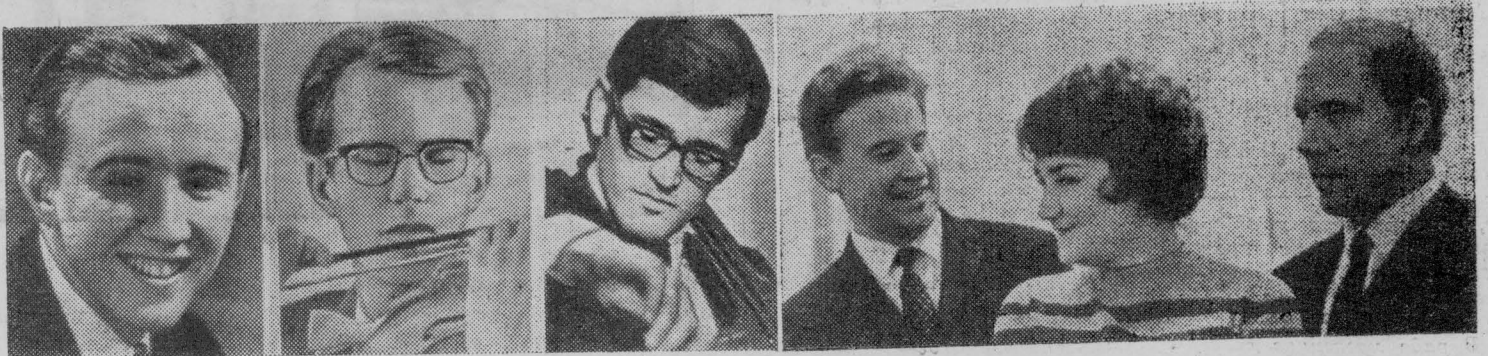
На днях в Москве закончился четвертый Международный конкурс имени П. И. Чайковского. На снимке: лауреаты конкурса, занявшие первые места и получившие золотые медали, советские исполнители (слева напра-