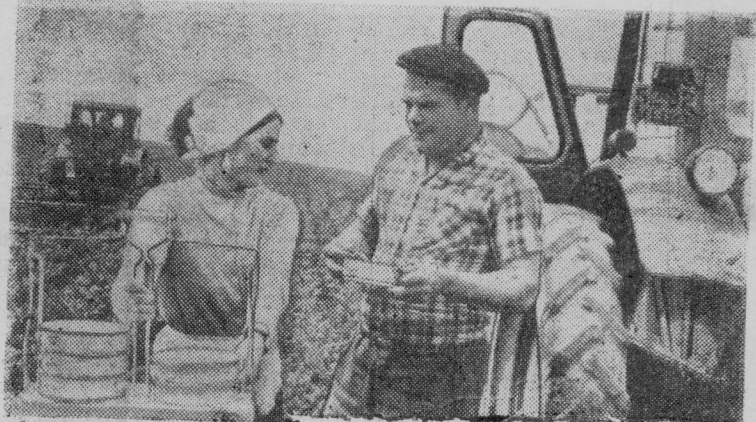
ВИННИЦКАЯ ОБЛАСТЬ. Кооператоры Гайсинского райпотребсоюза хорошо организовали обслуживание колхозников, работающих в поле. По разработанным маршрутам и графику ежедневно в поле выезжают четыре автолавки и 44 развозки с промышленными и продовольственными товарами, горячими обедами, кондитерскими изделиями и прохладительными напитками.