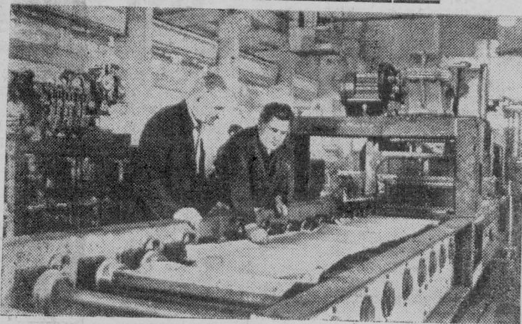
КАЛИНИНГРАДСКАЯ ОБЛАСТЬ. Уникальные автоматические линии и станки изготавливает Бежецкий опытно-экспериментальный завод Министерства тракторного и сельскохозяйственного машиностроения. Сейчас в сборочном цехе отлаживается автоматическая линия для отливки гильз цилиндров тракторных двигателей. Она упраздняет ряд трудоемких операций, повышает производительность, позволяет отлить 120 гильз в час.