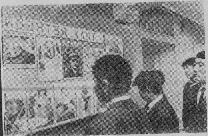
МНР. Недавно в небольшом городке Баянчандмань открылось профессионально-техническое училище, которое готовит специалистов для сельского хозяйства страны. Здание училища построено с помощью СССР и оборудовано всем необходимым для теоретических и практических занятий. Училище ежегодно будет выпускать 600 специалистов для села.