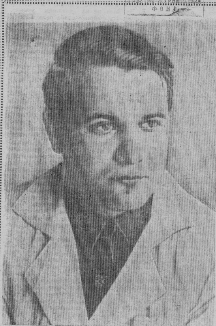
Завтра — день медицинского работника. К торжественным дням подводят итоги свершенного, намечают перспективы. Даже в личном.

В этой связи особое значение приобретает дальнейшее развитие социалистического соревнования, создание материально-технической базы животноводства. (Окончание на 2 стр.)