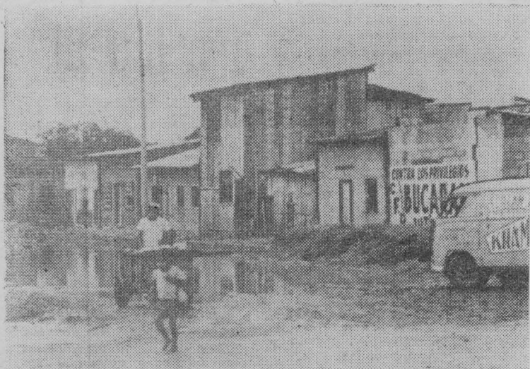
В Эквадоре все острее ощущается нехватка жилищ. Более половины населения Гуаякиля — крупнейшего города страны — живет в крайне тяжелых антисанитарных условиях, которые усугубляются в период дождей.