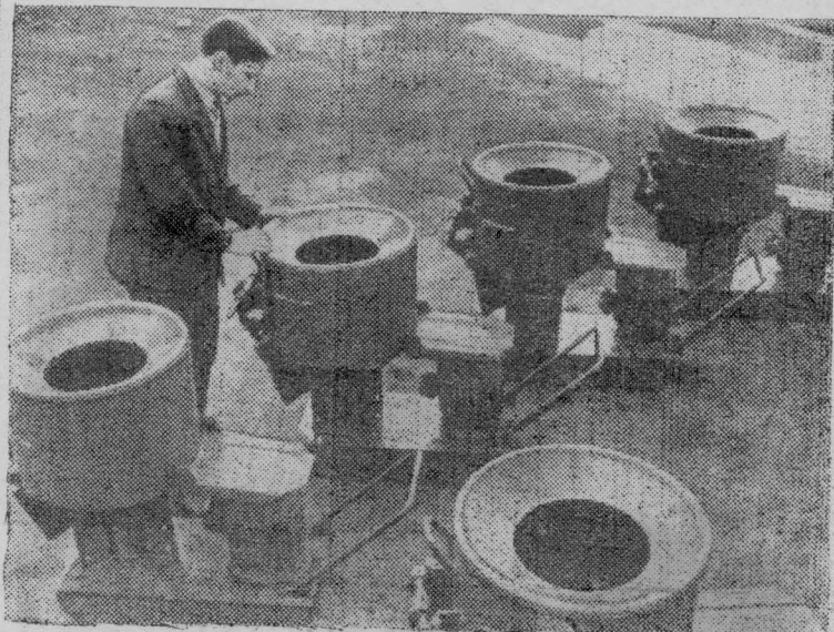
НОВОСИБИРСК. Смесителю „С-868“ с маркой Ново-сибирского завода строительных машин присвоен Знак качества.