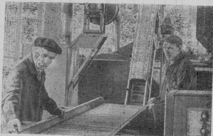
Свердловский завод торгового машиностроения освоил производство линий для сортировки и расфасовки фруктов. Изготовлена также опытная линия расфасовки картофеля в сетки по два-три килограмма.