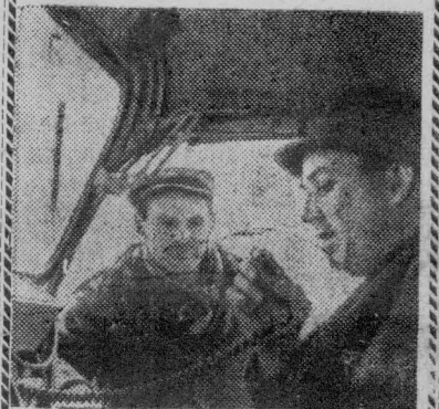
Благодаря радиосвязи повышается оперативность в руководстве полевыми работами в совхозах и колхозах Сибири.

В совхозе «Емельяновский» Красноярского края радиостанции установлены на автомобилях руководителей хозяйств, в отделениях совхоза, на автомобилях техпомощи, в ремонтных мастерских.