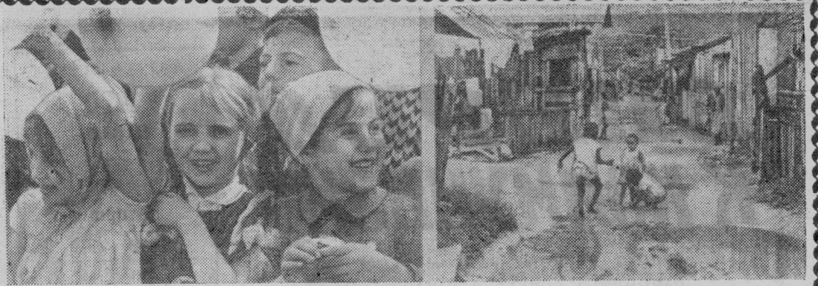
На снимке слева — счастливые советские дети.