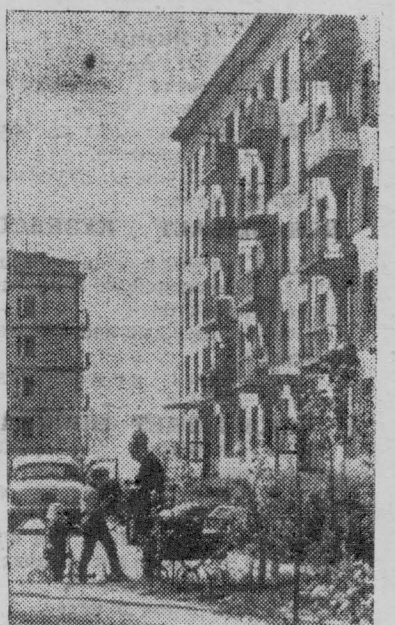
На снимке — в жилом поселке.

Рабочие и служащие «Коммунарки» живут в благоустроенных квартирах со всеми удобствами. Жилой фонд составляет 24.540 квадратных метров.