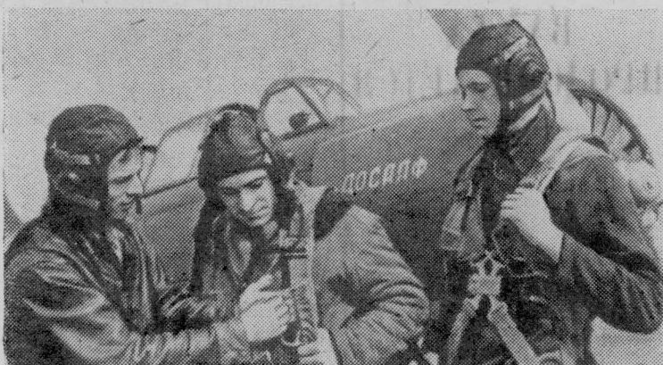
Тульская областная организация ДОСААФ заняла 1 место во всесоюзном социалистическом соревновании республиканских, краевых и областных организаций ДОСААФ в честь 100-летия со дня рождения В. И. Ленина.

ЦК КПСС, Президиум Верховного Совета СССР и ВЦСПС высоко оценили труд тульских досаафовцев, наградив коллектив Ленинской юбилейной почетной грамотой.