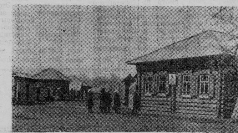
Шушенское (Красноярский край). Здесь открыт мемориальный музей «Сибирская ссылка В. И. Ленина».