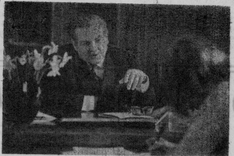
МОСКВА. В Главном ботаническом саду Академии наук СССР под руководством академика Николая Васильевича Цицина получен новый гибрид. Селекционеры скрестили для этого рожь и пырей — сорняк зерновых культур. В результате получился гибрид, содержащий до 20 процентов клейковины — белкового вещества, присущего из всех зерновых культур только пшенице. Благодаря клейковине пшеница обладает великолепными хлебопекарными свойствами. Академик Цицин считает новый гибрид будущим конкурентом пшеницы.