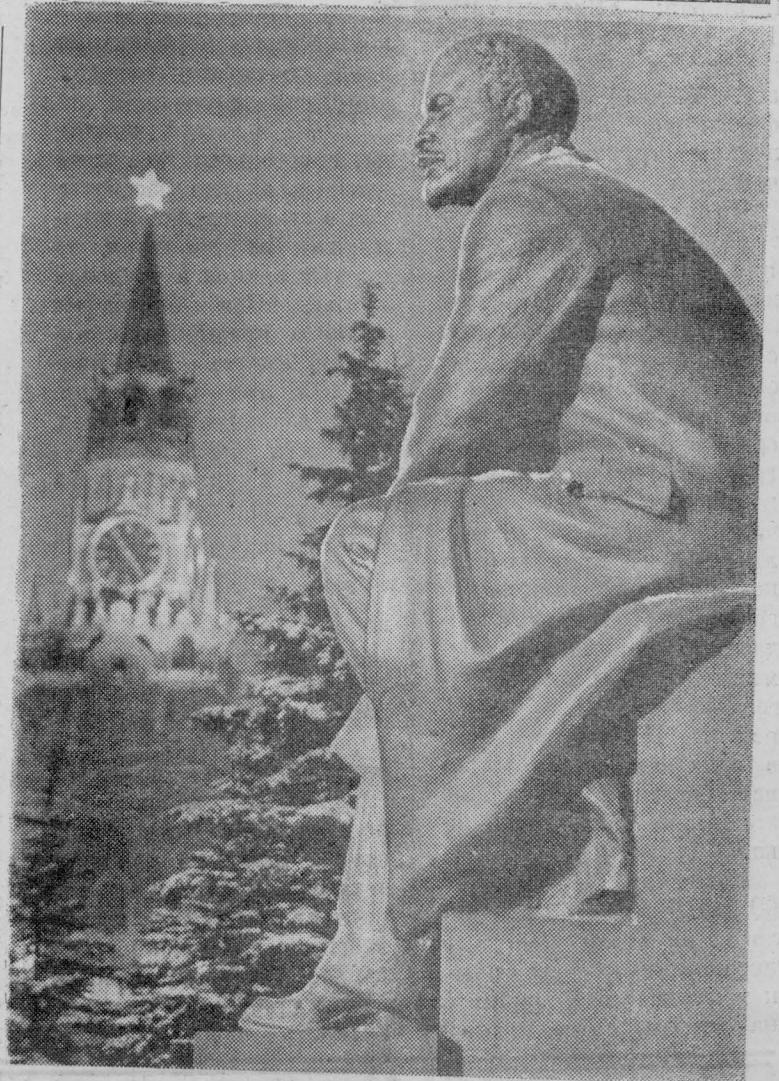
Москва. Памятник В. И. Ленину в Кремле.

Пропагандисты, политинформаторы, агитаторы, все работники идеологического фронта призваны вести широкую работу по разъяснению идей и положений Тезисов среди трудящихся, непосредственно увязывая их с практическими задачами каждого совхоза, колхоза, предприятия и тем самым способствовать мобилизации трудящихся на успешное выполнение принятых социалистических обязательств юбилейного года.