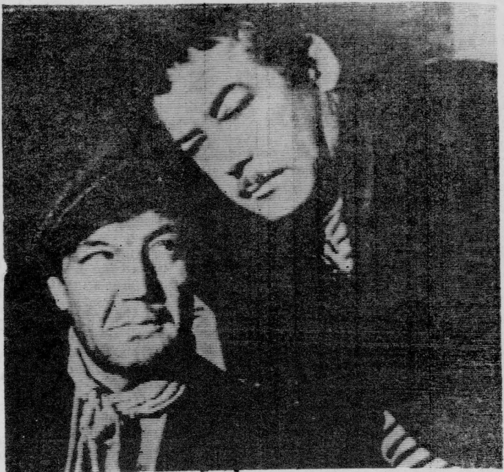
Кадр из нового художественного фильма «Взрыв после полуночи».