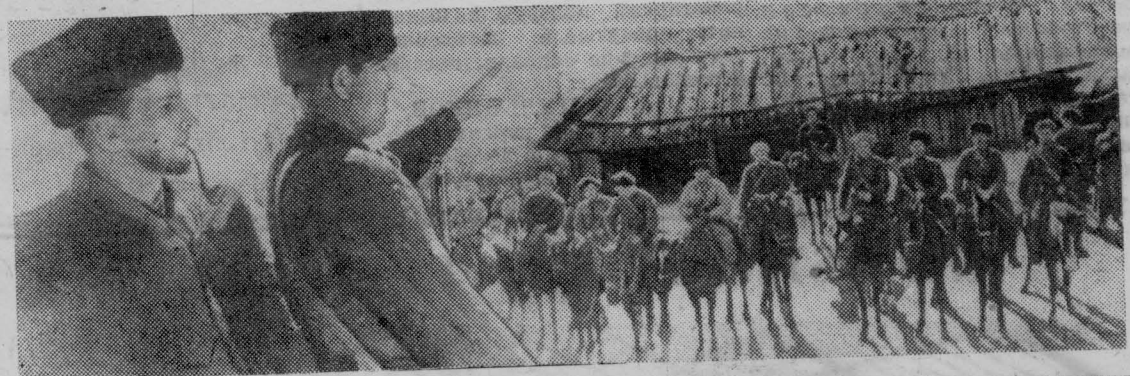
1942 год. Партизаны Северной ОсетиИ получают задание перед выступлением.